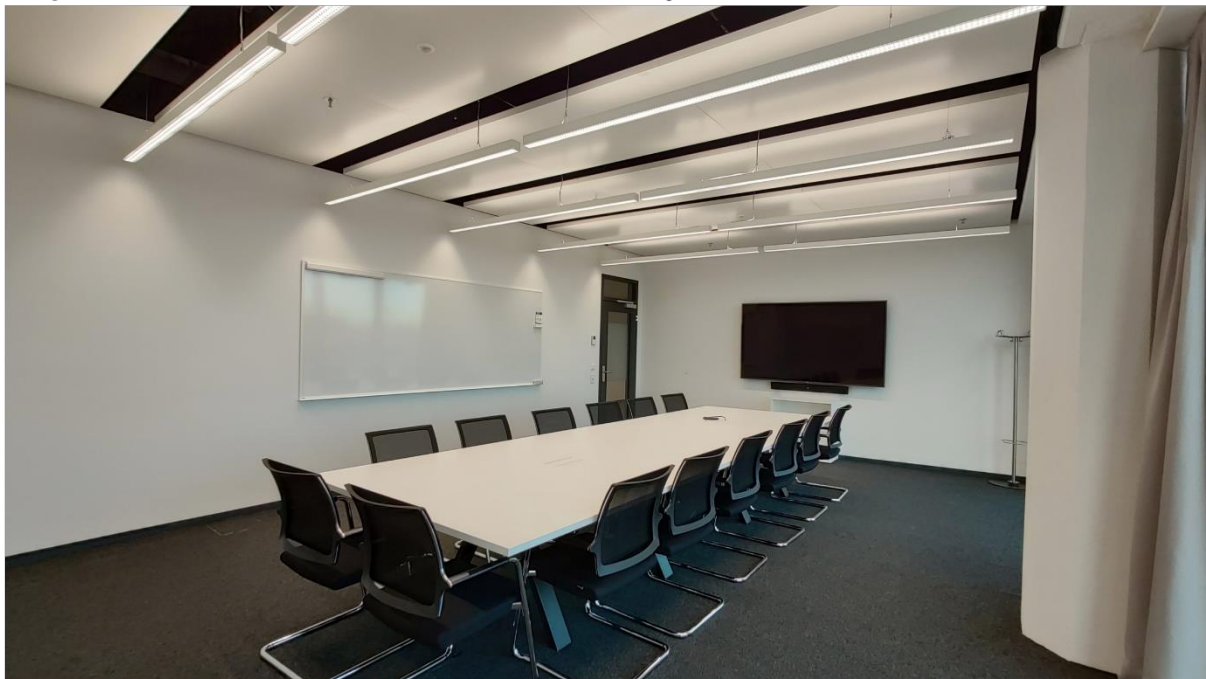
Sitzungszimmer 7 + 8