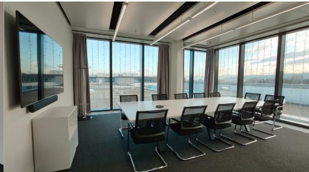
Sitzungszimmer 5 + 6